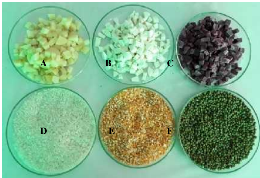
Gambar 1. Bahan utama media tumbuh jamur Trichoderma (A=kentang, B=ubi kayu, C=ubi jalar ungu, D=beras, E=jagung, F=kacang hijau).

Cara kerja yang sama dilakukan untuk ubi kayu (UKDA) dan ubi jalar ungu (JUDA). Pada bahan berupa yaitu beras (BDA), jagung (JDA) dan kacang hijau (KHDA), setelah bahan dicuci kemudian dilakukan perlakuan yang sama seperti bahan asal umbi-umbian (Gambar 1). Setelah media di autoclave kemudian dimasukan ruang isolasi sampai media agak mendingin, kemudian dituangkan kedalam cawan petri. Setiap media diulang sebanyak 5 ulangan.