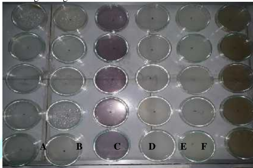
Gambar 2. Media tumbuh jamur Trichoderma satu hari setelah inokulasi pada beberapa media tumbuh hari setelah inokulasi (A=media kentang/PDA, B=media ubi kayu/UKDA, C=media ubi jalar ungu/JUDA, D=media beras/BDA, E=media jagung/JDA dan F=media kacang hijau/KHDA).

(Uruilal et al. , 2012) dan steril yaitu mendekatkan api lampu spritus pada saat inokulasi berlangsung. Isolat jamur Trichoderma kemudian diinkubasi pada suhu ruangan 26°C dan kelembaban 80% selama 6 hari (Gambar 2).