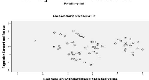
Gambar 3 Hasil Uji Heteroskedastisitas

Berdasarkan Gambar 3 dapat diketahui bahwa sebaran data tidak bertumpuk satu bidang, melainkan berpencair dan berada di atas 0 dan di bawah 0, sehingga semua variabel bebas tidak terjadi heteroskedastisitas.